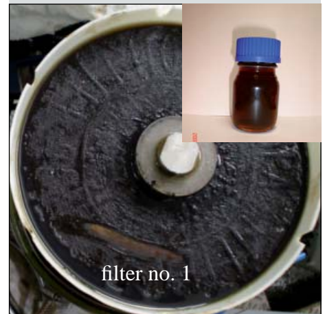
filter no. 1

Europafilter elementet viser store mengder klebrig hartz på filter. Dette til tross for at øvrige komponent filtre ikke ga utslag på popup indikator.