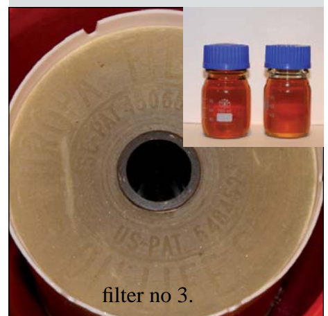
filter no 3.

Europafilter elementet viser store mengder klebrig hartz på filter. Dette til tross for at øvrige komponent filtre ikke ga utslag på popup indikator.